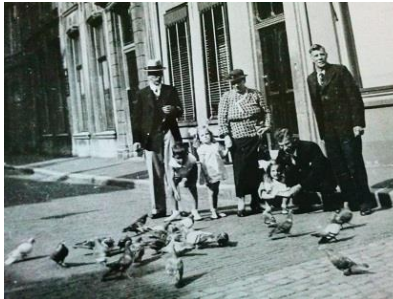
Die ‚Gute‘ Alte Zeit