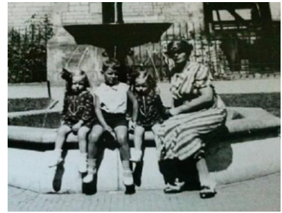
Ihre drei Kindern