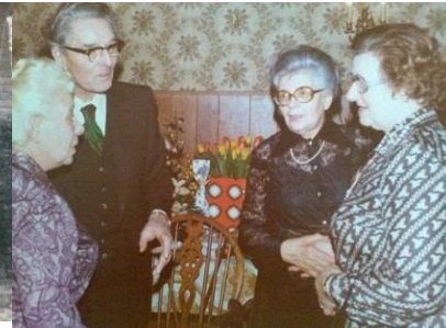
50 Jahre verheiratet