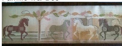
tüchtig. Sorgsam war sie für Ihre