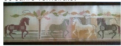
Kinder, Familie und Bekannten