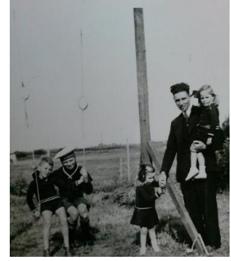
Kindern mit vader v/d/Bos