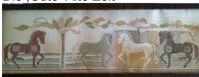
Rösli war immer kreativ und